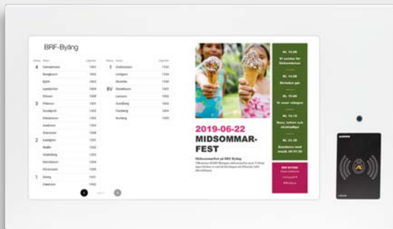
Välj vilken information du vill visa.